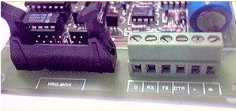
Conector cable plano (puerto A) y bornera con salida de tensión (puerto B)